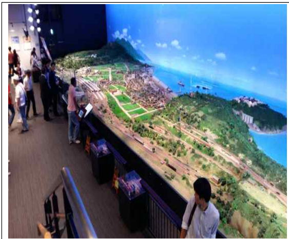
쓰루가시 축소 조형물