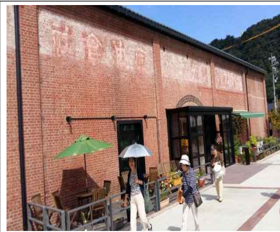
붉은벽돌 역사관 전경