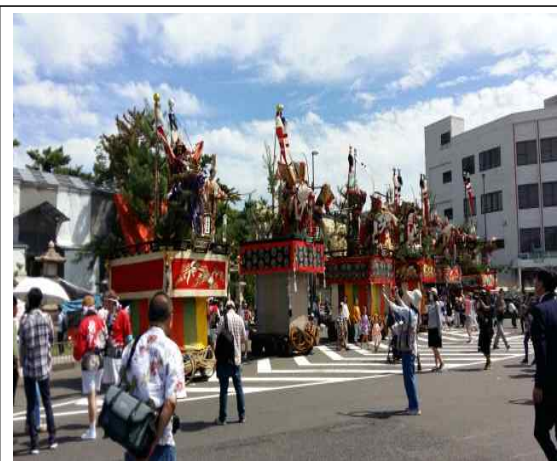
마츠리축제 전 (오전)