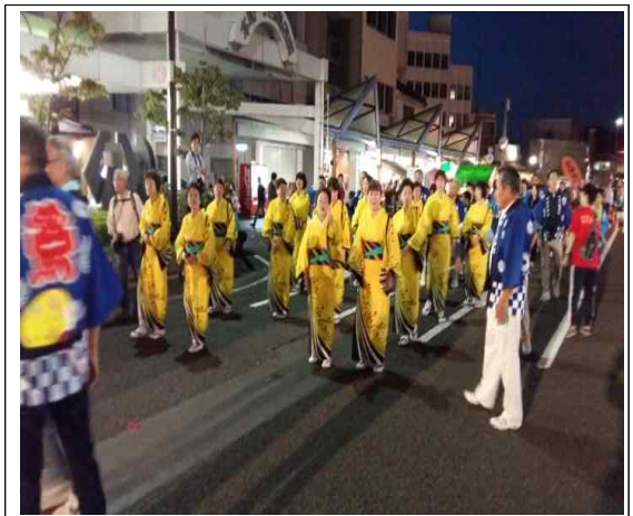
마츠리축제 중 (오후)