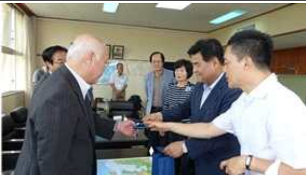
올림픽 홍보 및 마스코트 전달