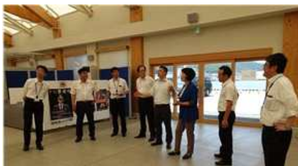
DBS크루즈 터미널 시찰