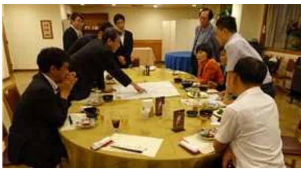
요나고시장 마이즈루항 설명