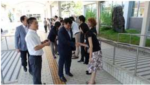
돗토리시청 입구 직원 환연