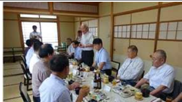
사카이미나토 시장 건배제의