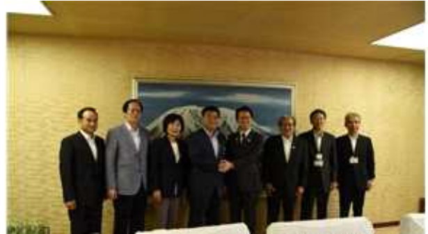
요나고시장, 의장 등과 기념촬영