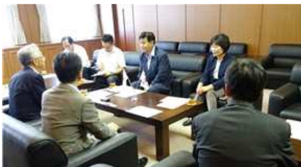
요나고상공회의소 부회장 면담