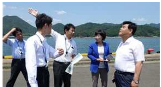
마이즈루항 시설 설명