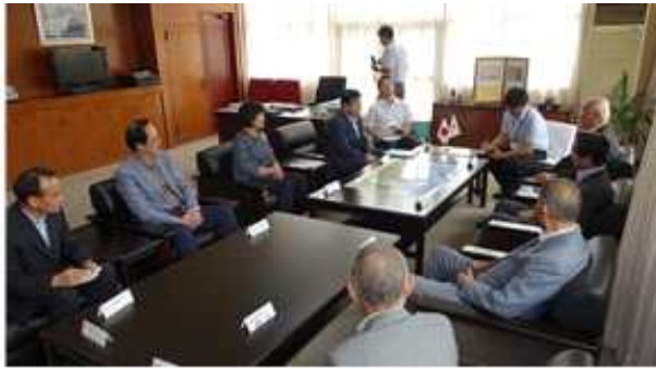
사카이미나토 시장 등 접견