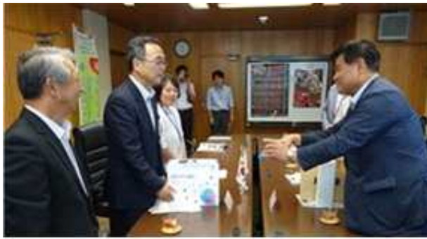
올림픽 홍보 및 마스코트 전달