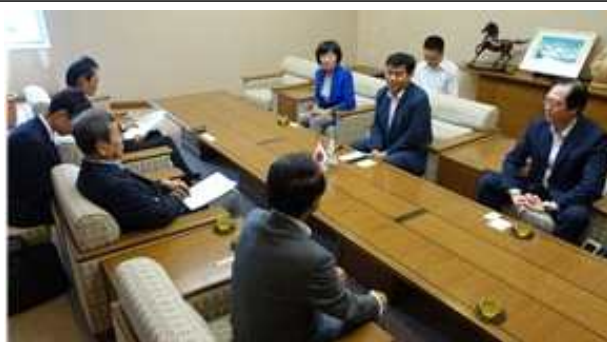
상공회의소 회장 접견